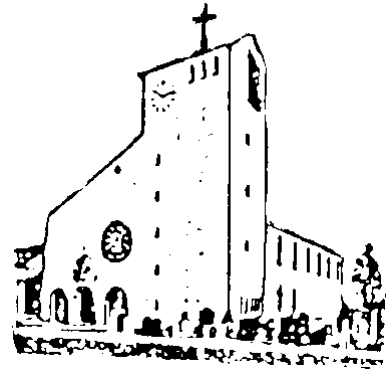
Herz Jesu Goldach

PFARRVERBAND HALLBERGMOOS Sonntag 06.06.2021 bis Sonntag 27.06.2021 10./11./12./13.So.i.JKr.