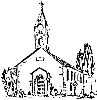
St. Theresia Hallbergmoos

PFARRVERBAND HALLBERGMOOS Sonntag 06.06.2021 bis Sonntag 27.06.2021 10./11./12./13.So.i.JKr.