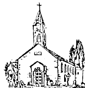
St. Theresia Hallbergmoos

am Samstag, 20. Mai, um 19.00, in Herz Jesu Goldach, feierliche Messe mit anschließendem Stehempfang in Goldach. Dazu sind Alle sehr herzlich eingeladen.