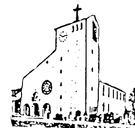
Herz Jesu Goldach